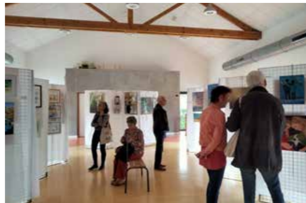
vue de l'exposition de l'Atelier du 1er mai 2024.

Nous rencontrons souvent des personnes qui ont l'envie de peindre et qui ne font pas le pas parce qu'elles considèrent qu'elles ne savent pas peindre et ne pourront pas l'apprendre. Cela s'apprend comme toute chose et ces personnes seraient surprises de voir combien elles font vite des progrès. Pour rejoindre l'atelier, il n'est pas nécessaire de savoir peindre ou dessiner. Les séances sont autant de moments de détente et bien être qui permettent un ressourcement face à la vie quotidienne. Il est possible de s'inscrire à tout moment en cours d'année. L'Atelier organise chaque année une exposition le 1er mai, montrant les œuvres des peintres réalisées dans l'année. L'exposition de 2024 fut bien appréciée par tous et c'est avec plaisir que nous avons accueilli un grand nombre de visiteurs.