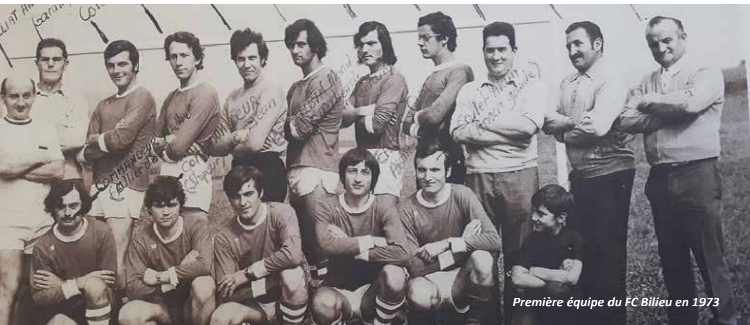
Première équipe du FC Bilieu en 1973